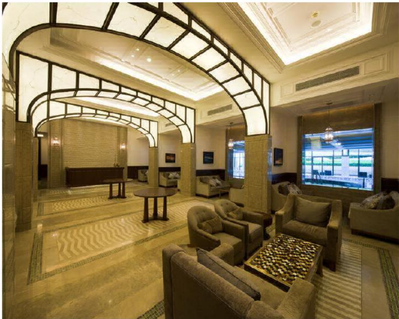
远雄集团徐汇园顶级豪宅会所