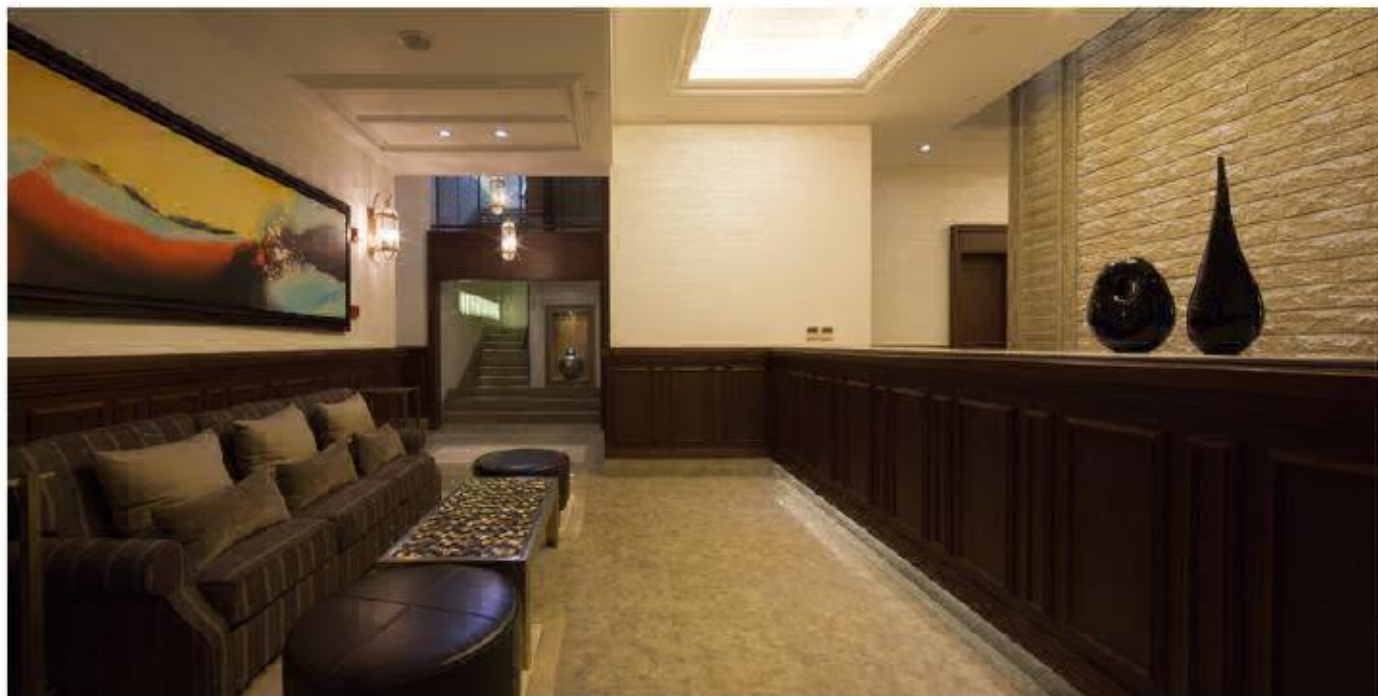
远雄集团徐汇园顶级豪宅会所

抽取相关要素——设计概念的思路独具新意，绝不沿袭传统，充分理解项目文化历史、周边环境等，抽取可用要素加以发挥，形成设计概念。