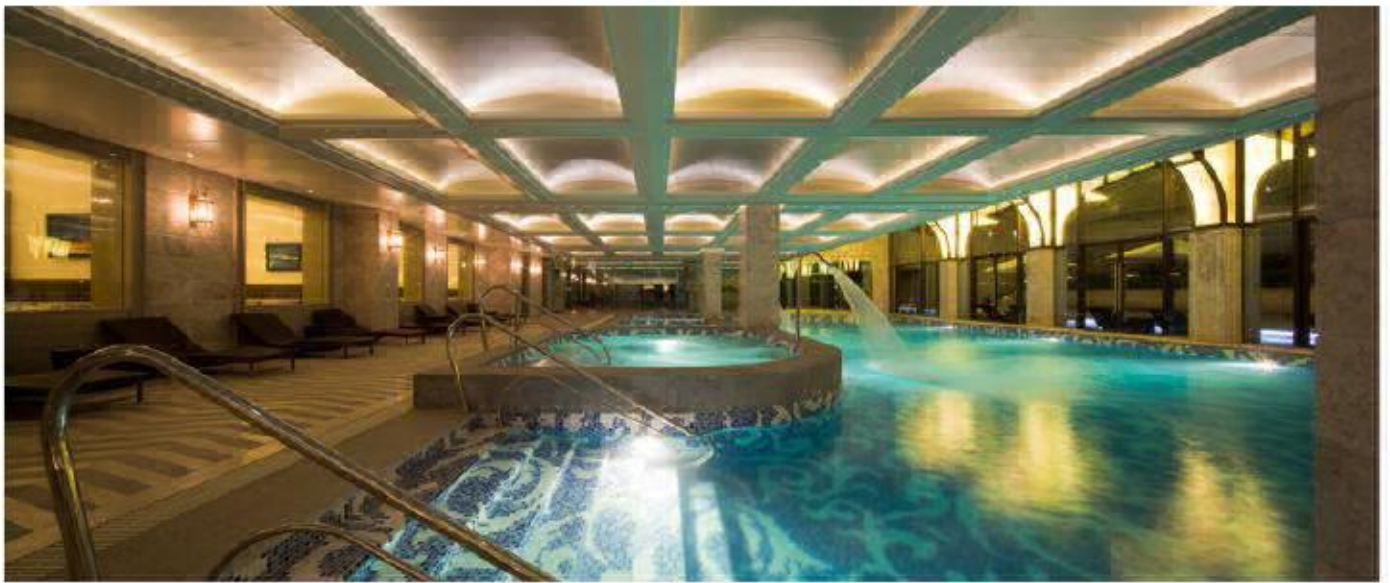
远雄集团徐汇园顶级豪宅会所